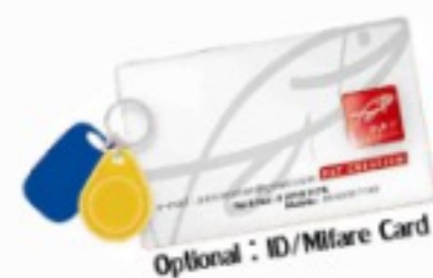
Optional : ID/Mifare Card